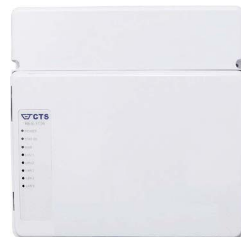
CPE/Fiberkonverter CTS HES-3106

Anslut den box du får från din leverantör till valfri port i fiberkonvertern.